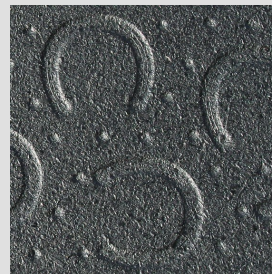
Fer à cheval